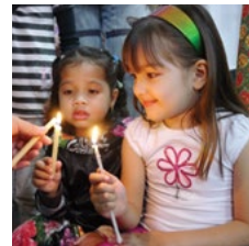
Portada: Misa de vigilia, Iglesia católica San Francisco de Asís, San Pablo, Brasil. La Virgen María Asunta es patrona de diversas poblaciones en Iberoamérica, en particular España, Guatemala, México, Nicaragua y Paraguay.